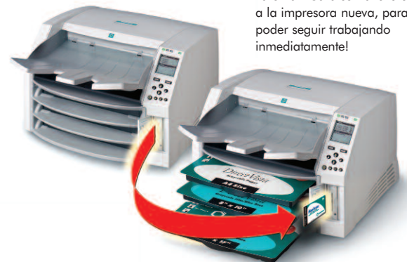
Ilustración de un Modelo GS de 3 bandejas

La Smart Card se transfiere a la impresora nueva, para poder seguir trabajando inmediatamente!